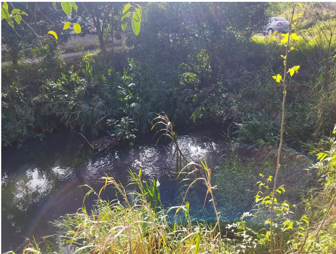
Figura 2. Córrego existente. Fonte: Autor, 15/07/2022.

Este é o parecer. Vistas à chefia da Diretoria de Meio Ambiente e Agropecuária ou da Divisão de Controle Ambiental desta Secretaria.