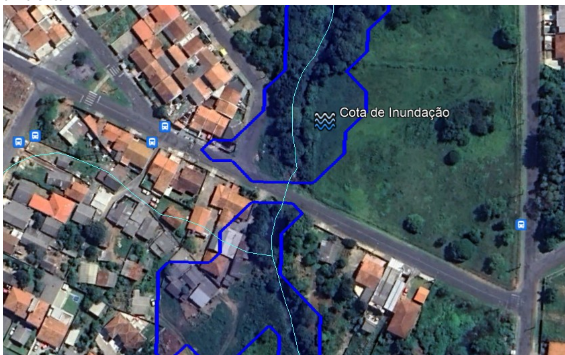
Figura 1. Área analisada aproximada. Existência de córrego cadastrado, APP – Área de Preservação Permanente e Cota de Inundação.

A Divisão de Controle Ambiental de Campo Largo, em análise aos autos, referente a solicitação de Parecer Ambiental a respeito de solicitação de galeria pluvial junto ao córrego que atravessa a Rua Cabral, Jd. São Vicente, coordenadas cartográficas aproximadas WGS84 22J UTM 0647037 E, 7181925 N, segue parecer ambiental: