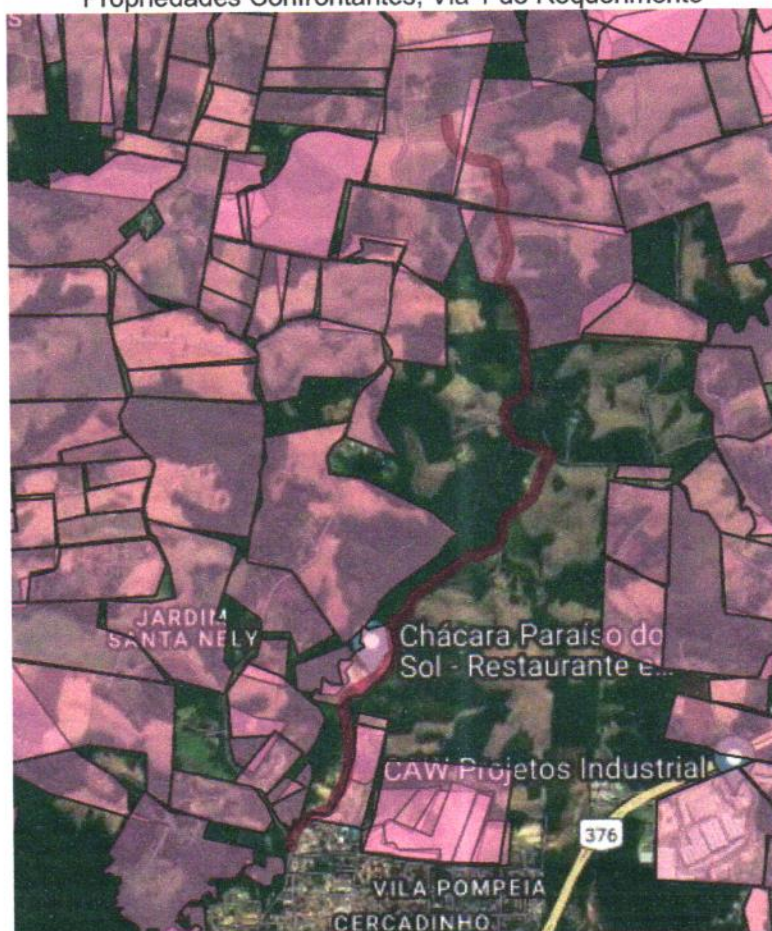
Propriedades Confrontantes, Via 1 do Requerimento

Início: Rua Ignácio Belinovski, fim: Rua José Kula