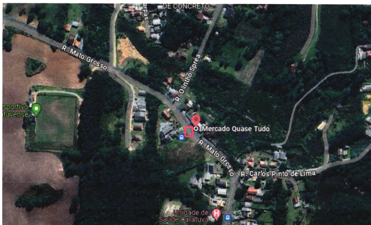
Figura- Mapa do Local.