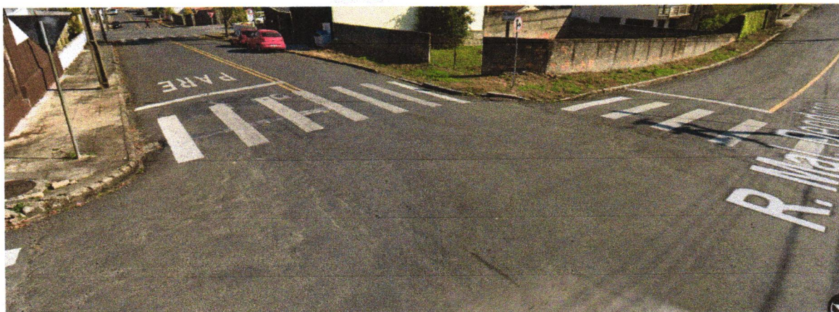
Acidente ocorrido em 30/04/2025