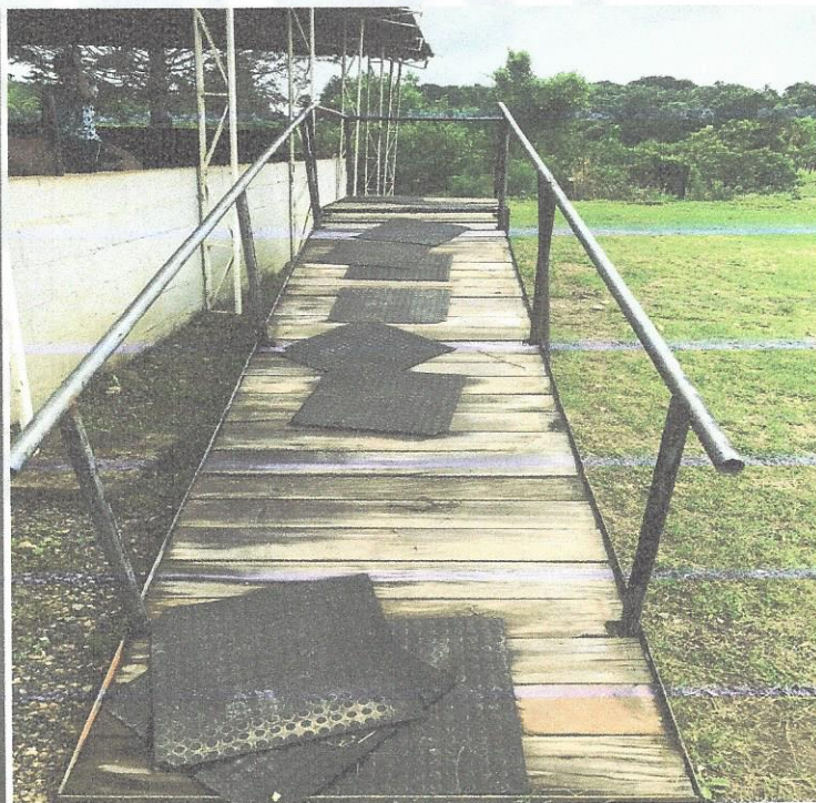
Rampa de Montaria Danificada...