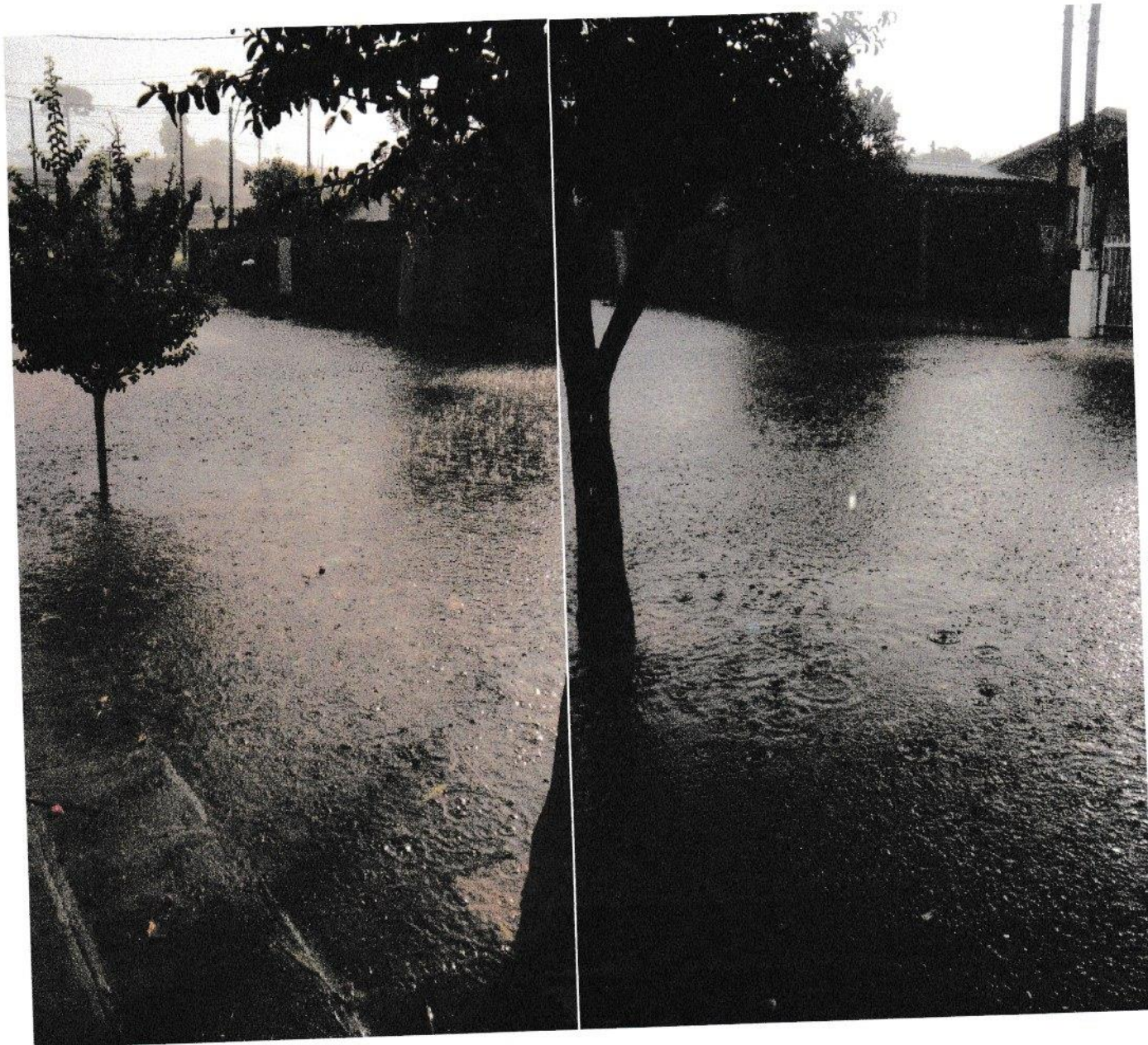
Foto: Rua Irene Amábile S. Teixeira Requerimento 59/2021 – Ver. Luiz Scervenski