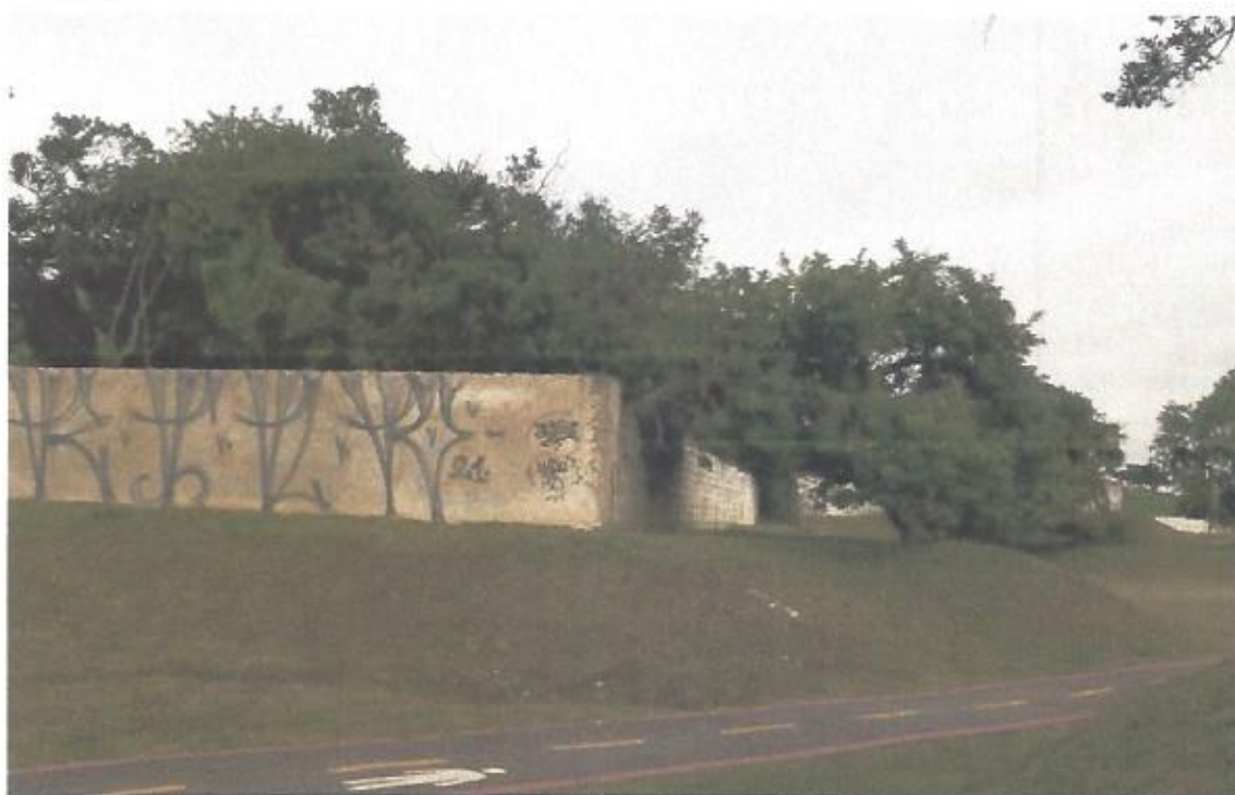
Imagem: Muro do estacionamento da Prefeitura Municipal de Campo Largo