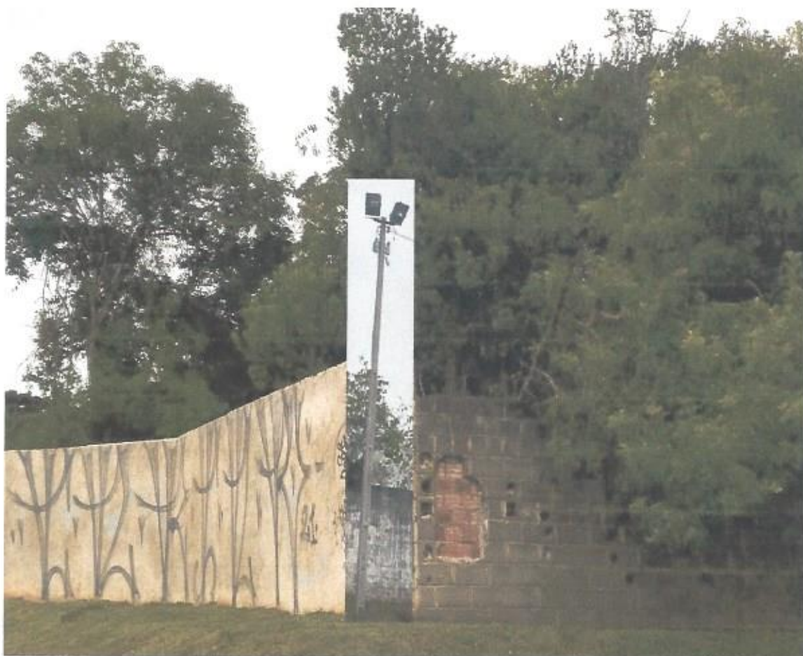
Imagem: Local para implantação de iluminação