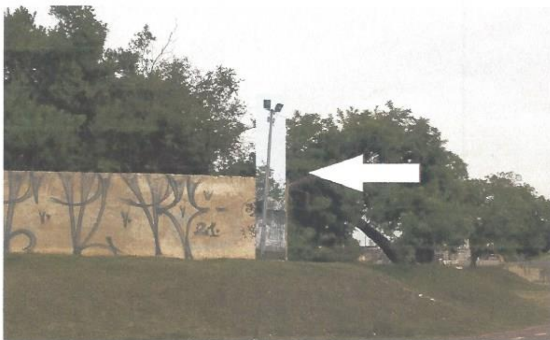
Imagem: Possível implantação de iluminação