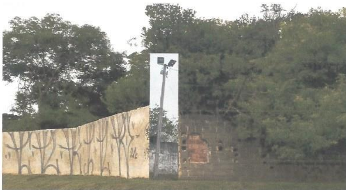
Imagem: Possibilidade de local para implantar iluminação