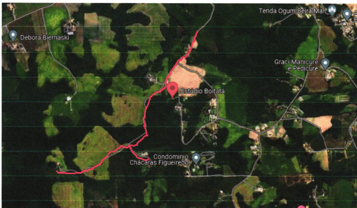
FIGURA- Mapa do local.