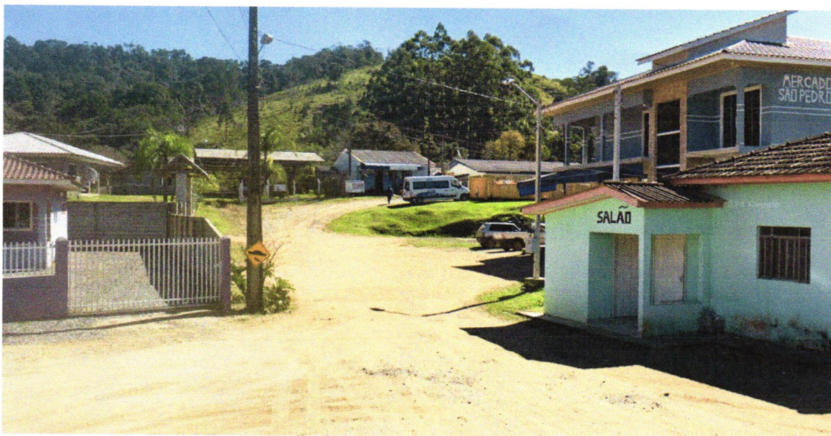
POLACO PRETO VEREADOR